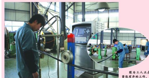
因为工人正在紧张有序的工作。

当企业经过了初级阶段、发展阶段的变迁后逐步成熟起来,企业同心创业、同利求发展的基本问题基本得到解决,企业最危险的时期则已经过去,企业的长远发展之途并没有得到解决。