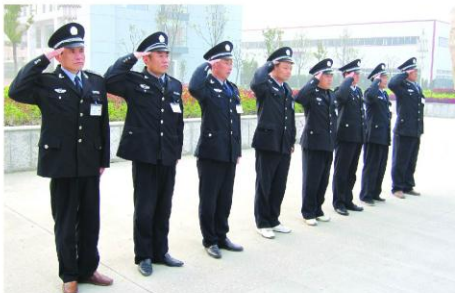
2010年4月6日,滨江公司保安队按计划正式开展为期15天的军事训练,参训队员精神饱满,认真体会每个动作要领,此次军训

将有利于保安队整体业务素质的提高,并促进公司保安队建设工作。因为保安队员们正在认真训练。