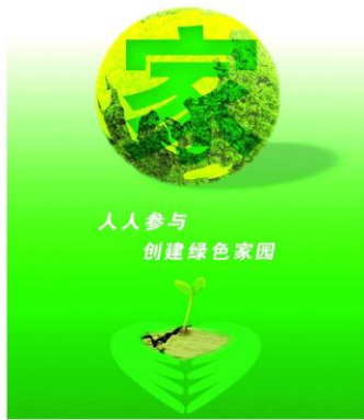
人人参与 创建绿色家园

节约资源和保护环境,关系到大家的切身利益和生存、发展。合理使用自然资源,减少各种人为排放对环境的危害,保护我们的共同家园,已经成为全社会