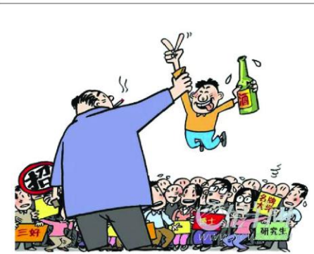
雇主说:“我们需要真正的人才:半斤不醉,一斤不倒!”